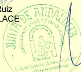
Luciano Poyato Roca Presidente de UNAD